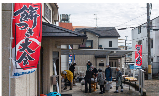
真新しい幟をたてて

来られ今年も成田山の節分祭と重なったこともあり一八〇名を越える人数となり食べられずに帰られる方もおられました。杵をふるってお餅をついて下さった方々、下準備(ポップコーンは何度も練習しました)当日お手伝いしていただいた方々